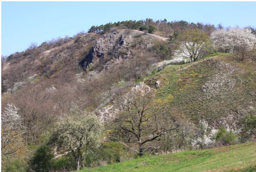
Abb. 2: Blick auf den Höllberg im NSG Haarberg-Höllberg mit Trockenwäldern, Felstrockenrasen und Felsen.