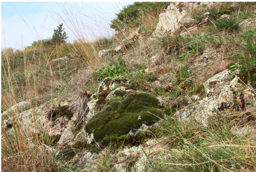
Abb. 3: Die submediterran-subozeanische Grimmia laevigata im Felstrockenrasen des Haarbergs.

Grimmia montana BRUCH & SCHIMP. Hypnum jutlandicum HOLMEN & E. WARNCKE Isothecium myosuroides BRID. Lophozia bicrenata (HOFFM.) DUMORT. Mnium hornum HEDW. Pleuridium acuminatum LINDB. Thuidium tamariscinum (HEDW.) SCHIMP. Ulota bruchii HORNSCH. ex BRID.