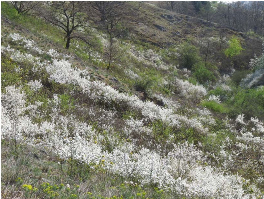
Abb. 5: Prunus spinosa dringt in Trockenrasen des NSG ein und verdrängt durch Lichtentzug und Laubwurf vor allem submediterrane Moose.

Biotop im Untersuchungsraum gefährdet. Der stärkste Bedrohungsfaktor ist die Sukzession von Sträuchern und Bäumen. Besonders angesprochen werden soll die Schlehe ( Prunus spinosa ), die bereits größere Flächen der Felstrockenrasen erobert hat (Abb. 5). Nicht unterschätzt werden darf die Gefahr durch die sich ausbreitenden Bestände der Douglasanne ( Pseudotsuga menziesii ). Sie besiedeln bereits, ausgehend von einem kleinen angepflanzten Bestand, die angrenzenden Trockenrasen. Obwohl das Gebiet von einem stark frequentierten Wanderweg durchkreuzt wird, bleiben die wertvollsten Teile aufgrund ihrer schweren Zugänglichkeit vor dem Betreten weitgehend geschützt.