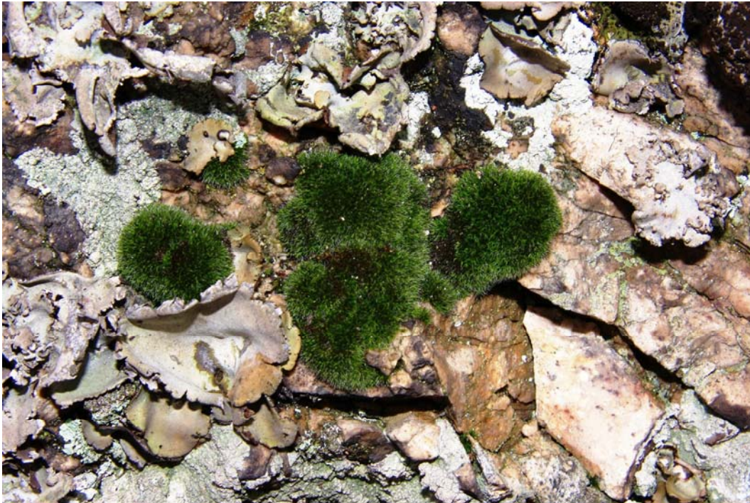
Abb. 4: An einer Felswand am Höllberg ist die subozeanisch-montane Grimmia montana mit der Nabelflechte Umbilicaria grisea vergesellschaftet, die ähnliche ökologische Ansprüche stellt.

4.1.6 Subozeanisch-submediterrane Moose: Orthotrichum lyellii HOOK & TAYLOR, Tortula ruraliformis (BESCH.) INGHAM.