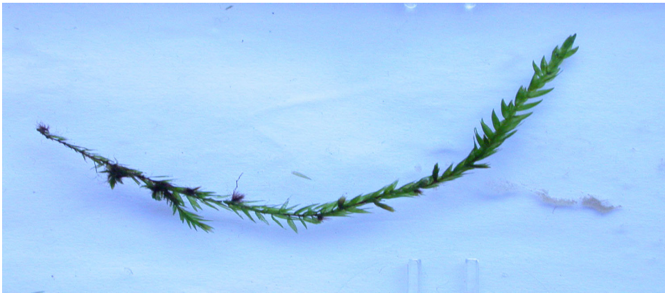
Abb. 2: Einzelne Fontinalis-Pflanze; linka alte, am Standort gebildete Blätter, rechts Neutrieb in Kultur

Ein ähnlicher Kulturversuch an Fontinalis „kindbergii“ (allerdings in einem Warmhaus) ergab ebenfalls eine „Rückbildung“ zu normalen Pflanzen (Frahm 2004b). Dieser Versuch sollte noch an anderen abweichenden Formen der Art wiederholt werden. Es könnte sein, dass F. antipyretica morphologisch sehr plastisch ist und es sich bei den vielen dutzend infraspezifischen Taxa (welche ja nicht nur das Problem der „gracilis“-Formen betreffen) um Modifikationen als Anpassung an unterschiedliche Standorte handelt und nicht etwa um einen Schwarm von Geno- oder Ökotypen. Warum ha man aber früher nicht schon einmal Kulturversuche gemacht? Das hätte uns die Beschreibung dieses Wustes von Varietäten und Formen erspart.