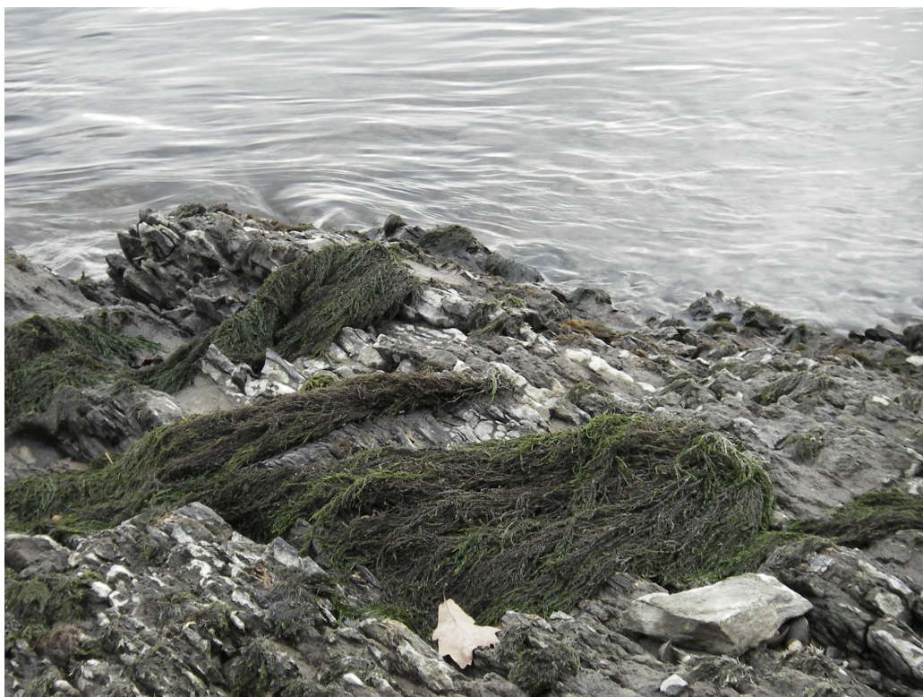
Abb. 1: Schwaden rundblättriger Fontinalis bei Niedrigwasser im Rhein (Rolandseck/Mittelrhein, 27.11.2005)