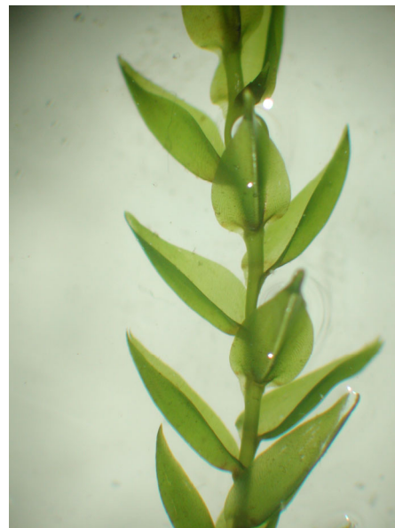
Abb. 4: Blätter des Neutriebes aus Kultur